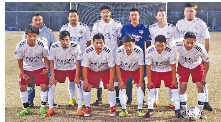
Selección del Arsenal