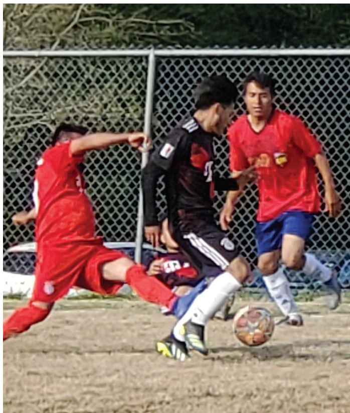
Real Córdoba Vs. Independiente