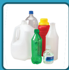
BOTELLAS DE PLÁSTICO Y JARRAS