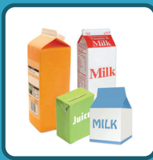
ENVASES DE CARTÓN