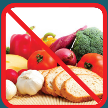
Comida o líquidos