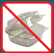
Recipientes de comida