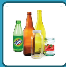
BOTELLAS DE VIDRIO

— Por favor NO PONGA los siguientes artículos en su bote de reciclado. —