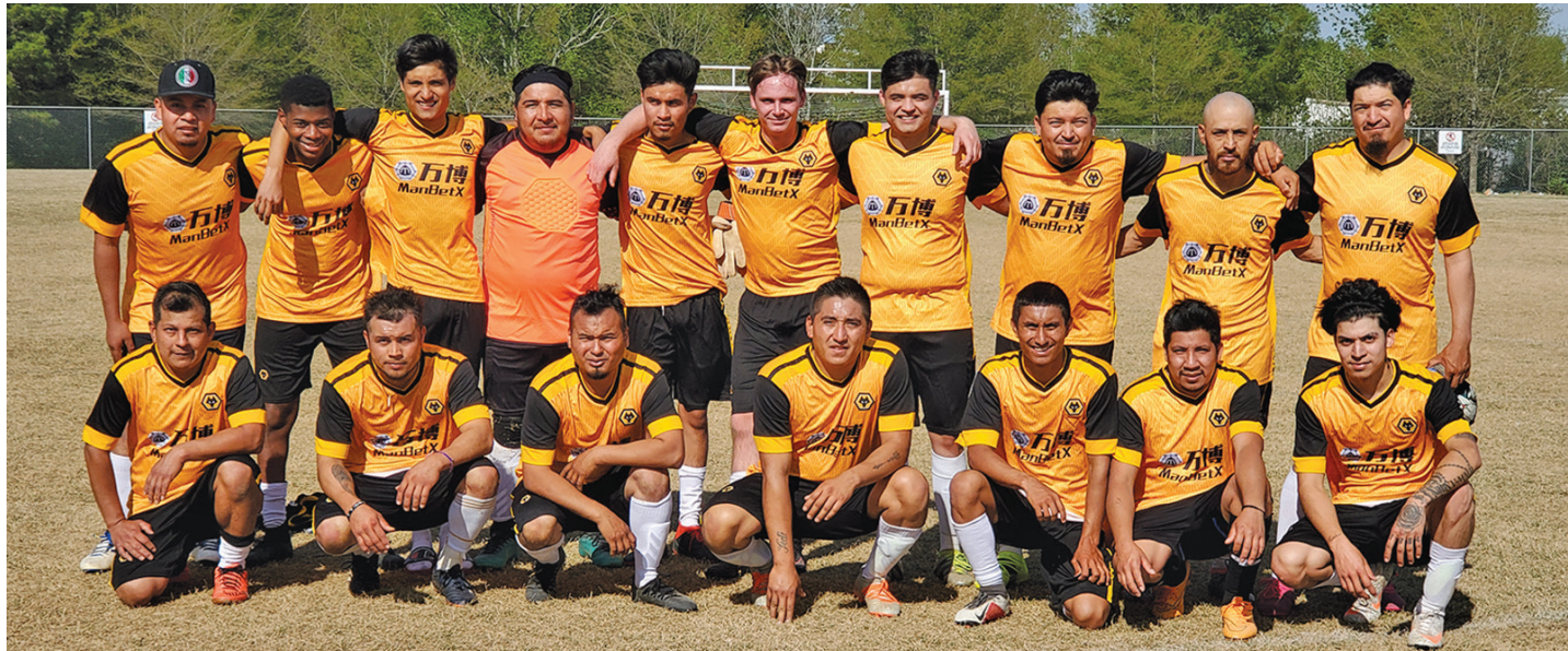
Selección de Tigres