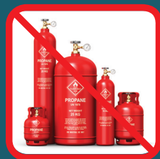
Tanques de propano