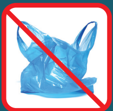
Bolsas de plástico

— Por favor NO PONGA los siguientes artículos en su bote de reciclado. —