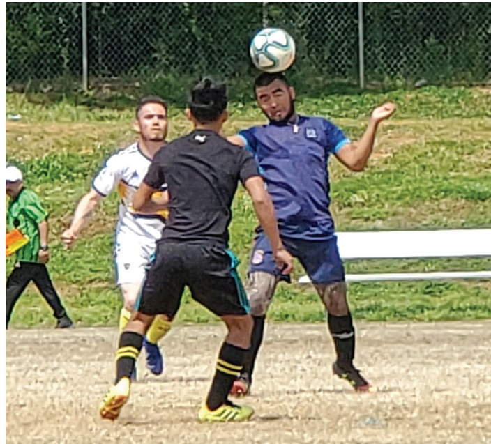
Puebla Vs. Boca Jr.