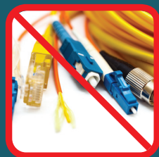
Mangueras, cables, cadenas, ganchos, o electrónicos