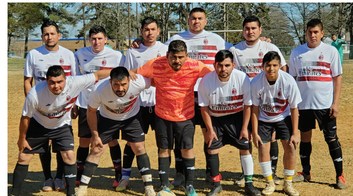
Selección de Maleantes