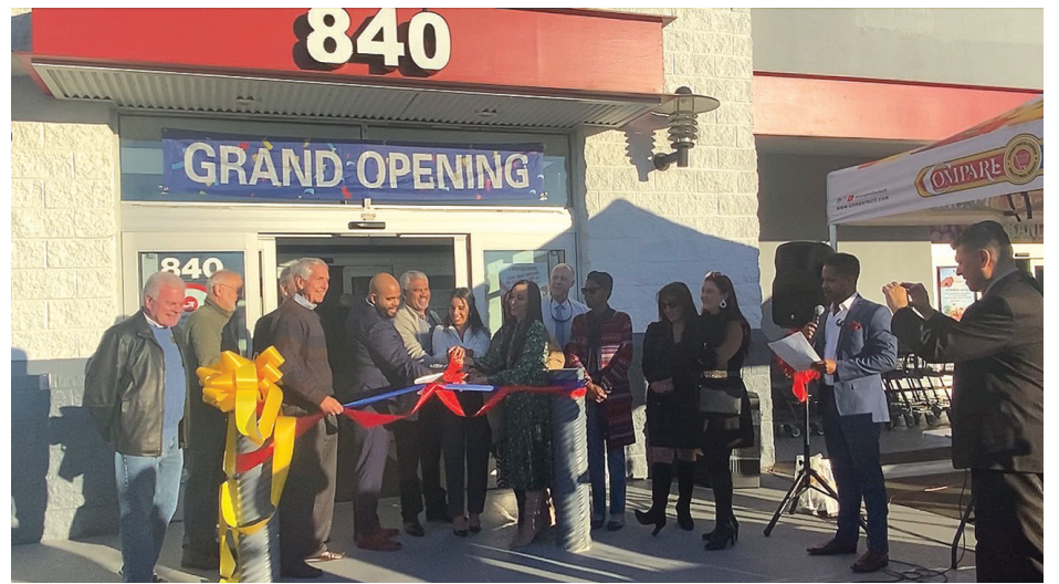
Compare Foods sigue creciendo en Carolina del Norte y abre nueva tienda en Concord (Foto: La Noticia).

"Un miembro de la familia que dio un viaje para acá a Carolina del Norte y vio la necesidad, porque vio a la comunidad latina y se dio cuenta de que no había un supermercado como el Compare Foods, entonces ese miembro decidió mudarse para acá y abrir la tienda", relató, explicando que desde entonces procuran abrir nuevos mercados en aquellos vecindarios donde ven a más latinos para poder brindarles la oportunidad de hacer sus compras, como si aún estuvieran en Latinoamérica.