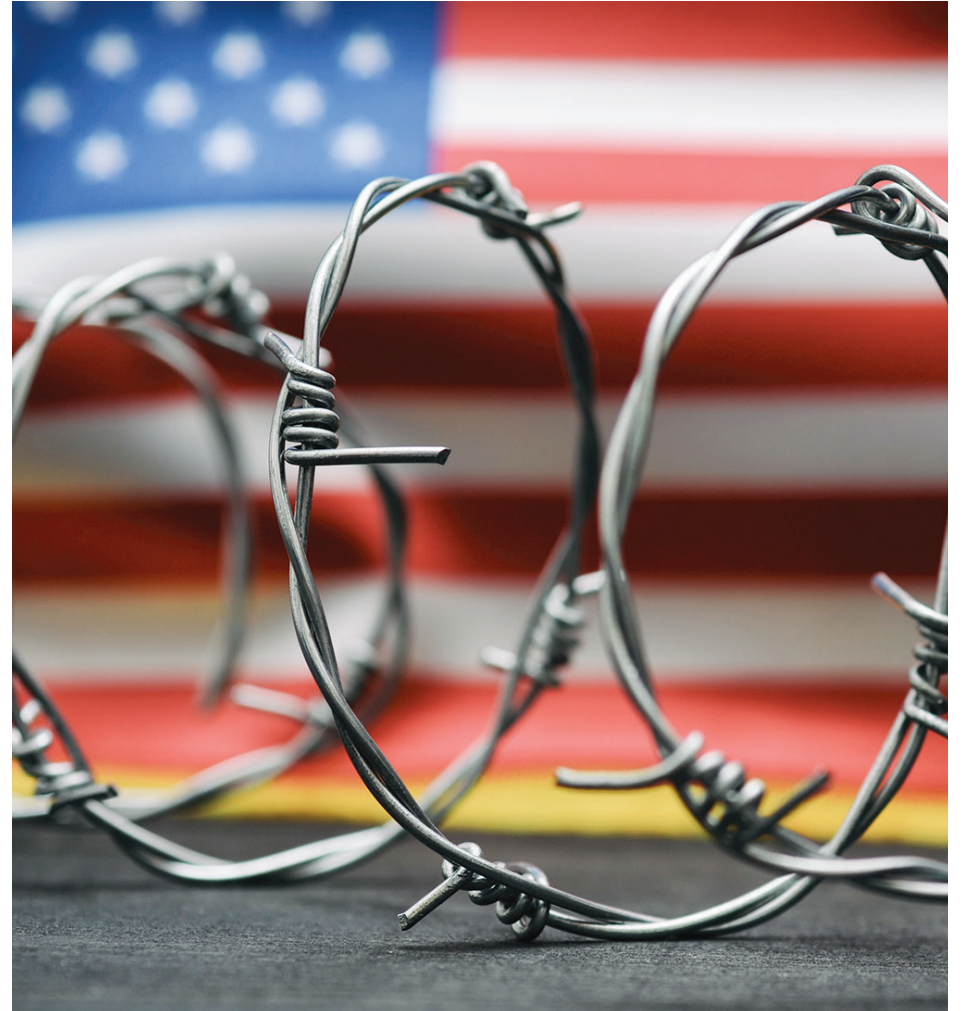
La inmigración irregular se trataría como un delito en el estado de Texas con la nueva ley antiinmigrante.

La Asociación Nacional de Funcionarios Latinos Electos y Designados (NALEO) se pronunció en contra de la nueva ley antiinmigrante de Texas. Aparte de declararla inconstitucional y muy costosa, la califican