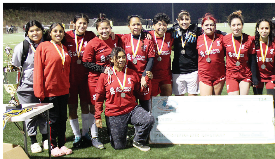
Honduras Progreso, los subcampeones de la temporada 2023 (Foto: cortesía Liga IASO).

Con este torneo se cerró la temporada 2023. Así que el Inter American Sports Organization (IASO) desea a los dirigentes de equipos, entrenadores, jugadores y público en general, una Navidad llena de bendiciones y felicidad.