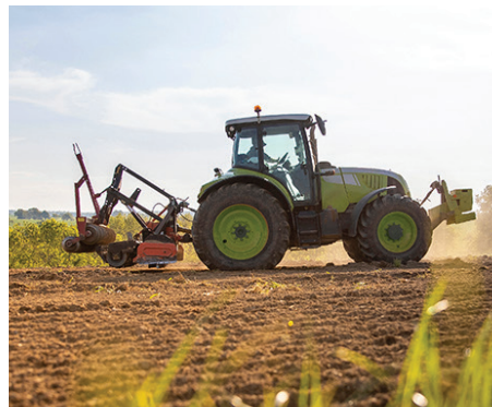
Carolina del Norte pierde alrededor de 55 acres de tierras de cultivo por día.

De acuerdo con el American Farmland Trust, Carolina del Norte es el segundo estado más amenazado del país en riesgo de perder tierras agrícolas (solo por detrás de Texas)