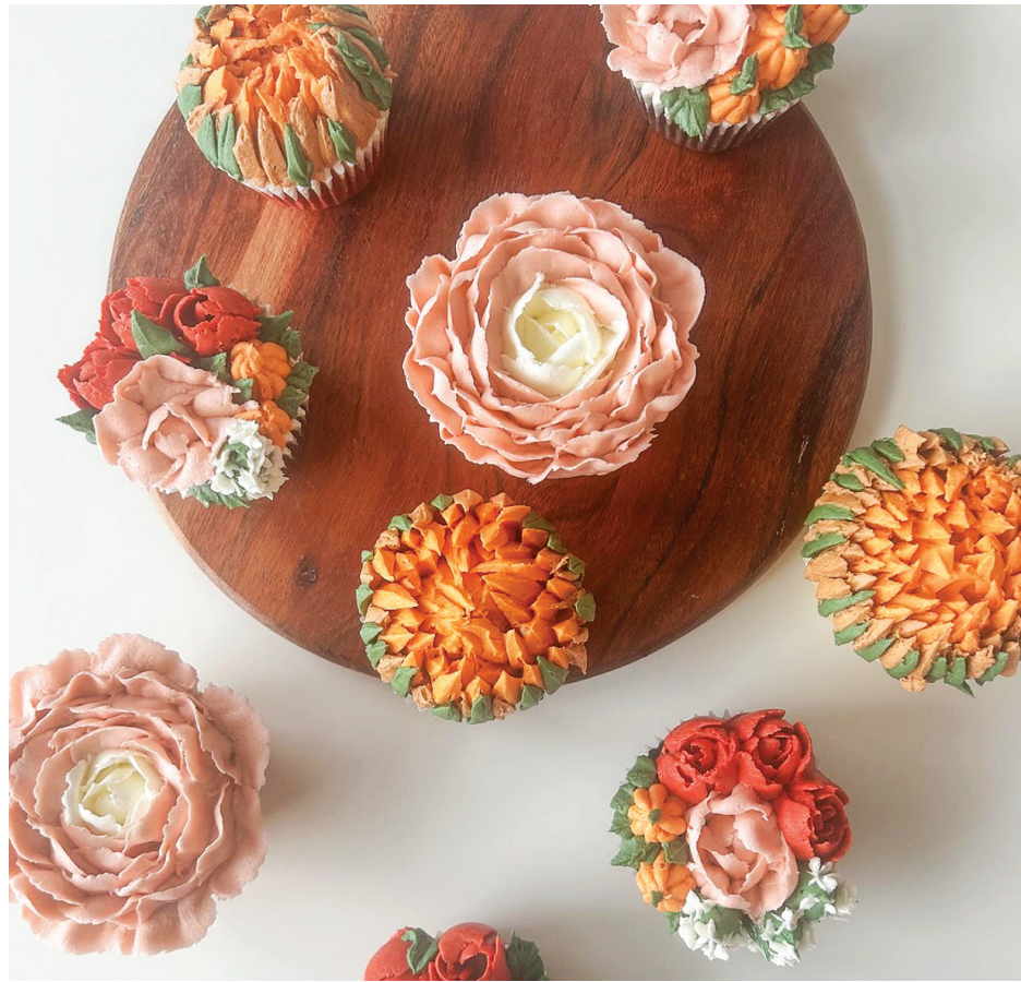
Galería de imágenes de productos de Joy Low Carb Bakery.