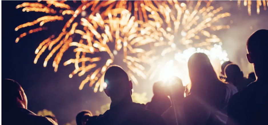
En el centro de la ciudad habrá un despliegue de fuegos artificiales de gran magnitud para toda la familia.