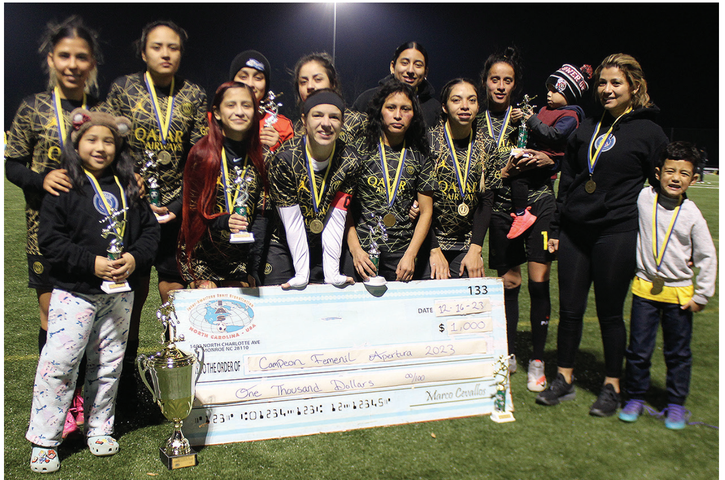
París Saint Germain logra coronarse como equipo campeón por cuarta vez (Foto: cortesía Liga IASO).

Una vez que finalizó el encuentro se procedió a la premiación respectiva, donde el equipo 'hondureño' recibió el respectivo trofeo como subcampeón del torneo, medallas y un estímulo económico de $400.