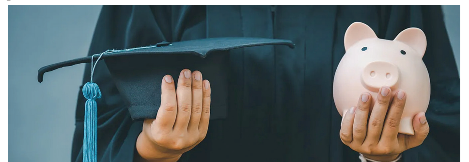
La versión anterior, llamada "Beca NC", para familias con bajos ingresos, se amplió para incluir a más estudiantes.

Para más detalles, visita la página: nextncscholarship.org