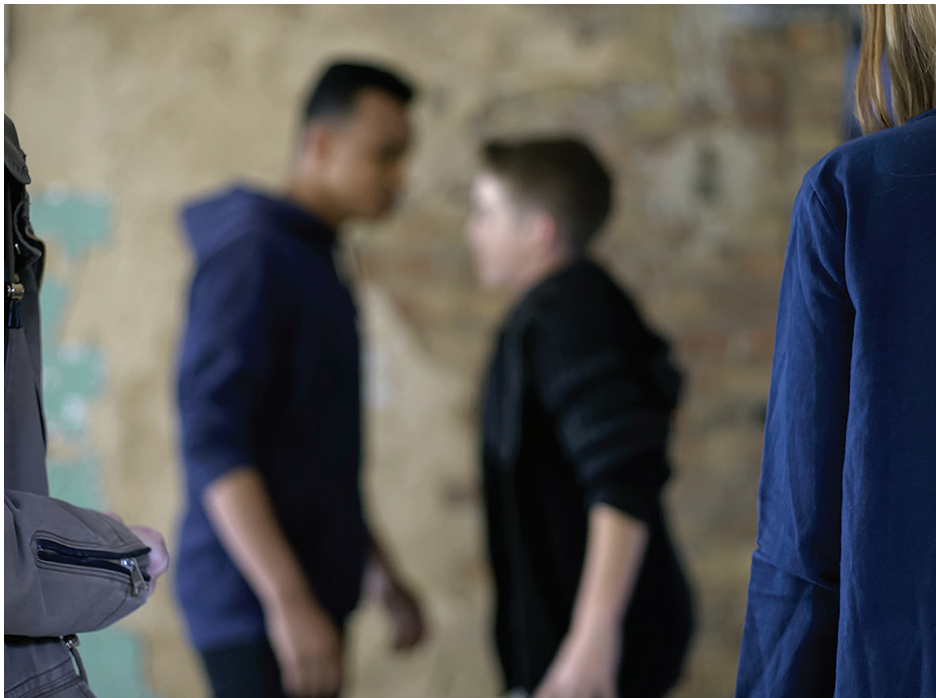
Tanto el asalto, como las agresiones y las riñas son considerados como delitos menores, pero la sanción puede agravarse según las circunstancias.