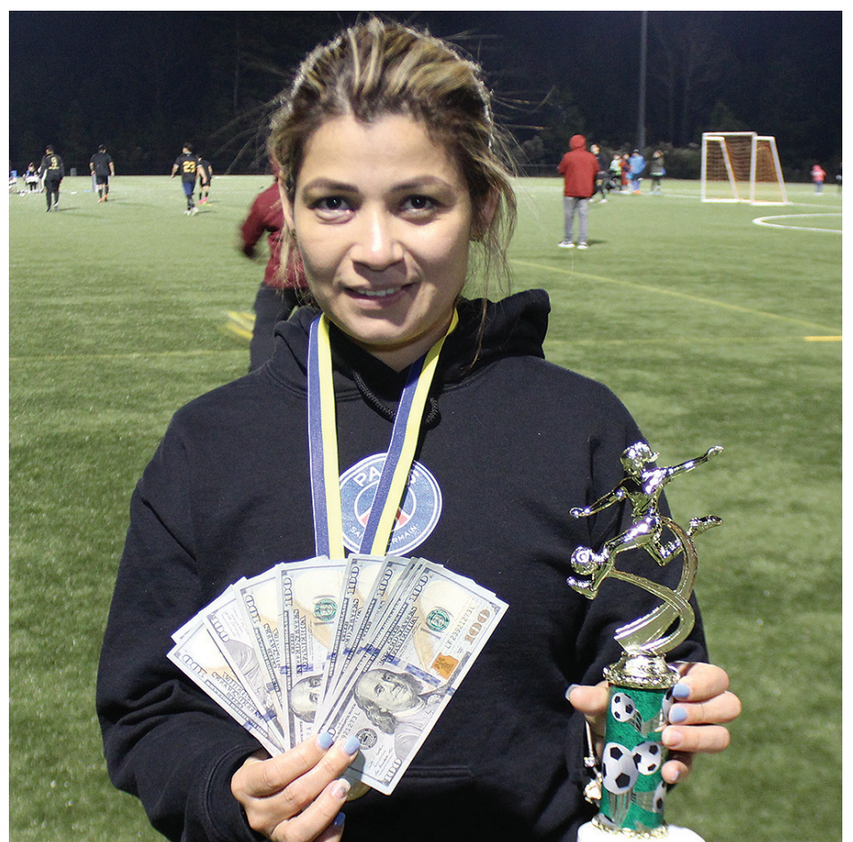
Dirigente de PSG recibió estímulo económico, trofeos y su respectiva copa.